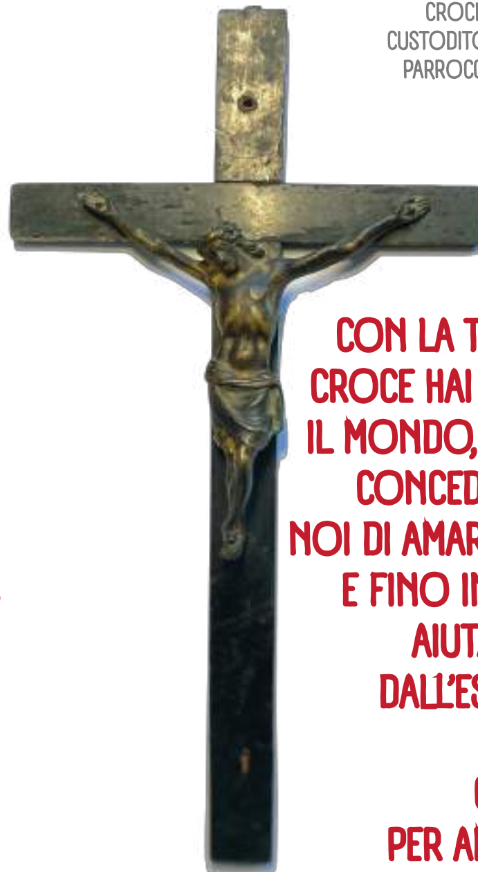
CROCIFISSO DI S. ELIA CUSTODITO NELLA CHIESA PARROCCHIALE DI RENO CENTESE

Qui viene interrogato e malmenato, nonostante la sua debole salute. Condannato a morte, insieme ad altri 25 Cristiani fu prima colpito di spada alle gambe e poi decapitato. La sua testa con quella del Vescovo, dei confratelli ed altri cristiani fu issata sulle mura all'ingresso della città, alla Porta Meridionale. Solo quel giorno furano massacrati oltre 120 cristiani.