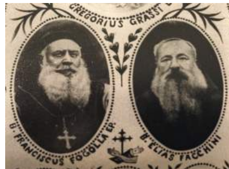
FOTO DI UNA LOCANDINA DI BEATIFICAZIONE DEL 1946 DOVE APPARE INSIEME A FOGOLLA

SIGNORE NOSTRO SAPIENZA ETERNA E PROVVIDENZA AMOREVOLE COLMA LA NOSTRA VITA DELLA TUA PRESENZA E RENDICI CAPACI DI SENTIRLA, VIVERLA E CUSTODIRLA CON LE NOSTRE SCELTE COME FECE S. ELIA IN TERRA DI CINA